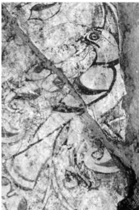
Détail du décor peint d'époque karakhanide trouvé dans le quartier résidentiel au-dessus du palais d'Abu Muslim à Afrasiab.